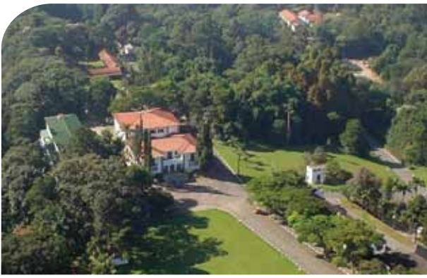
Vista aérea da sede atual do IF. São Paulo-SP