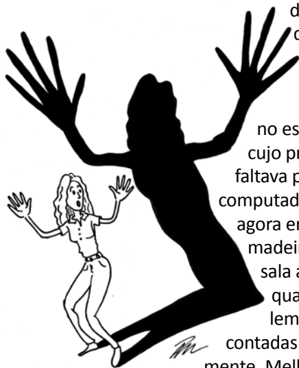
Ilustração: Paulo Muzio

Com mais de cem anos, o IF tem muita história. E histórias sobre seus vultos são narradas diariamente. Como não poderia ficar de fora, também tenho a minha experiência: fora numa noite de sexta-feira, não tenho certeza se... treze. Após o expediente, continuava no escritório para concluir os trabalhos cujo prazo expiraria às 20h, portanto, faltava pouco. Naquele silêncio, o som do computador, que durante o dia é imperceptível, agora era ruidoso e alto. Uma divisória de madeira e vidro canelado separava a grande sala ao lado. Com seus estalos, de vez em quando um calafrio percorria o corpo e lembranças de histórias fantasmagóricas contadas por colegas de trabalho surgiam na mente. Melhor deixar prá lá.